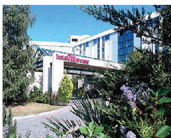
Hôtel Mercure Roissy